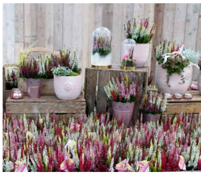
Vijfkleurige knopbloeiers genaamd HighFive zijn het nieuwste concept van Beauty Ladies. De toepassingsmogelijkheden zijn divers.