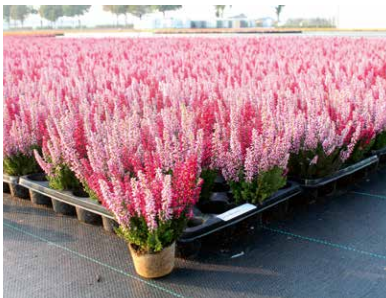
De meeste Beauty Ladies groeien in 9,5 cm-pot, maar deze in 6,5 cm-pot. Voor aflevering zet Canders deze mini- Calluna automatisch over van tray naar eindpot.

Momenteel zijn er bijna 100 kwekers die voor het Calluna -merk produceren. Sommigen kweken alleen Beauty Ladies, en dan ook nog eens in miljoenen. Anderen combineren de teelt met andere producten, zoals Erica , Gaultheria of Lavandula . „20%