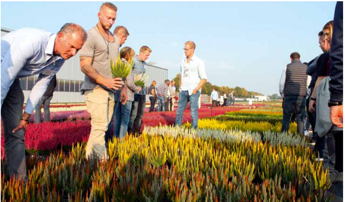
Kwekers en handelaren bekeken tijdens de viering van 15 jaar Beauty Ladies, op 23 september, de nieuwste rassen voor het Calluna-merk die Europlant Canders beproeft in Straelen.

Tekst en Foto's: Arno Engels Reageren? a.engels@hortipoint.nl